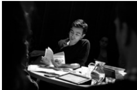
Woody Allen—de achtste Causerie op 16 februari 2013

alteriteit, en Proust-expert Donatien Grau werden parallellen tussen de films van Allen en de werken van Aristophanes besproken.