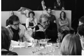
The Creation: On Cosmogony and Cosmology —de eerste Causerie op 2 juni 2012.

Lemmelijn (Professor Theologie, Katholieke Universiteit Leuven) en Francis Wolff (Professor Filosofie, École Normale Supérieure Paris) richtten zich op het idee van de schepping, benaderd vanuit zowel religie en mythologie als de ontwikkelingen binnen de moderne wetenschap.