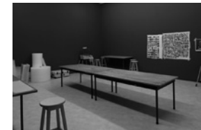
Alexandre Singhs atelier bij Witte de With.