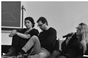
Scatology —de negende Causerie op 16 March 2013.

Repetities beginnen in het auditorium van Witte de With.