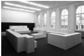
Installatieoverzicht Witte de With.

en religie. In tegenstelling tot traditionele lezingen en symposia waren de Causeries informele gesprekken tussen de kunstenaar en een expert op een bepaald gebied, in een ruimte ontworpen door Studio Miessen. De maandelijkse Causeries werden geïnitieerd en georganiseerd door Defne Ayas en Alexandre Singh, in overleg met schrijver Donatien Grau. ( Geluidsopnamen zijn op te vragen via info@wdw.nl )